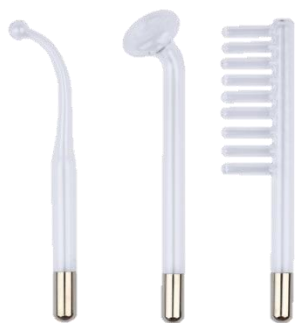
3 СТЕКЛЯННЫХ ЭЛЕКТРОДА