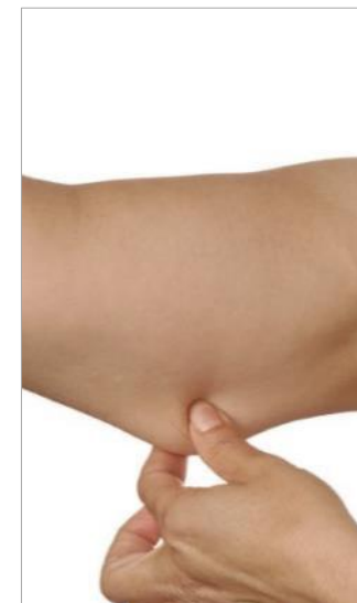
СНИЖЕНИЕ МЫШЕЧНОГО ТОНУСА