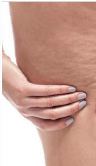
ЗАСТОЙ В ПРОБЛЕМНЫХ ЗОНАХ, ОТЕКИ