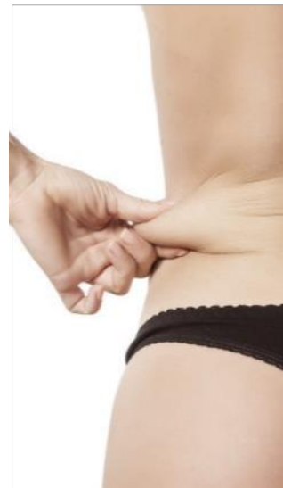
ДРЯБЛОСТЬ, РАСТЯЖКИ, ВОЗРАСТНЫЕ ИЗМЕНЕНИЯ КОЖИ