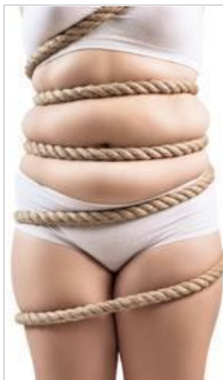
ИЗБЫТОЧНЫЕ ЖИРОВЫЕ ОТЛОЖЕНИЯ