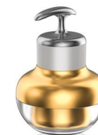
ОМОЛАЖИВАЮЩИЙ КРЕМ «МАТРИКСИЛ GOLD»