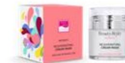
ОМОЛАЖИВАЮЩАЯ КРЕМ-МАСКА «МАТРИКСИЛ»