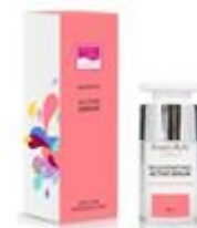
СЫВОРОТКА С МАТРИКСИЛОМ