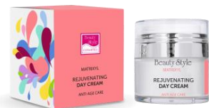
ДНЕВНОЙ КРЕМ С МАТРИКСИЛОМ