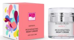
НОЧНОЙ КРЕМ С МАТРИКСИЛОМ