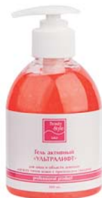
ГЕЛЬ «УЛЬТРАЛИФТ» BEAUTY STYLE

Активный гель для проведения аппаратных процедур (УЗ-массажа, микро-токовой терапии, миостимуляции). Омолаживает и увлажняет кожу. Для всех типов увядающей кожи.