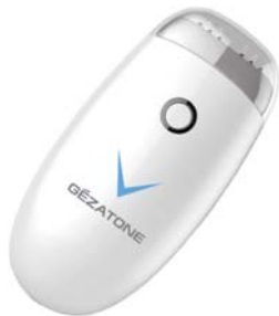
АППАРАТ ДЛЯ RF-ЛИФТИНГА V-LINE M1603

Трехмерное омоложение кожи и стимуляция выработки собственного коллагена и эластина в домашних условиях с помощью высокочастотных радиоволн.