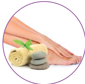
УХОД ЗА РУКАМИ И НОГАМИ

Уникальные технологии, позволяющие в домашних условиях провести высококачественные процедуры по избавлению от целлюлита и растяжек, улучшению тонуса кожи.