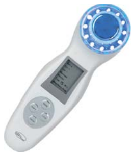
УЛЬТРАЗВУКОВОЙ МАССАЖЕР ДЛЯ ЛИЦА SUPERLIFTING M356

Проводить ультразвуковой массаж следует активными курсами в 6-8 недель, используя прибор 3 раза в неделю. Перед использованием прибора кожу необходимо очистить от загрязнений и макияжа. Затем рекомендуется нанести активную сыворотку. Ее насыщенная формула позволит быстро решить поставленные косметические задачи. Поверх сыворотки на обрабатываемый участок наносится проводящий гель, который обеспечивает равномерное распределение УЗ волн. По окончании процедуры гель рекомендуется смыть, а на лицо нанести крем по типу кожи.