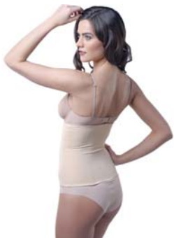
КОРСЕТ WAISTBAND SLIM&SHAPE

Корректирующий корсет из дышащего материала, созданного по инновационной технологии. Превосходно моделирует фигуру, создавая изящный стройный силуэт.