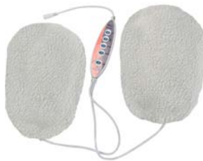
ТЕРМОВАРЕЖКИ ДЛЯ РУК С ИК-ПРОГРЕВОМ HAND SPA AMG115

Высокоскоростной набор для проведения процедур маникюра и педикюра. Семь сменных насадок с долговечным абразивным напылением.