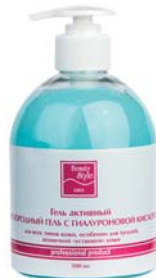
«КИСЛОРОДНЫЙ ГЕЛЬ С ГИАЛУРОНОВОЙ КИСЛОТОЙ» BEAUTY STYLE

Гель для всех типов кожи, особенно для сухой, дегидратированной кожи. Обеспечивает моментальное увлажнение, делает кожу гладкой и мягкой.