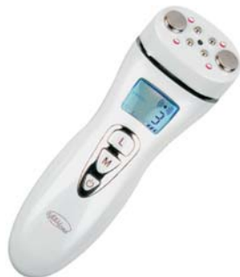
АППАРАТ ДЛЯ RF-ЛИФТИНГА RF-ЛИФТИНГ M1601

Трехмерное омоложение кожи и стимуляция выработки собственного коллагена и эластина в домашних условиях с помощью высокочастотных радиоволн.