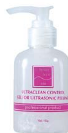
ОЧИЩАЮЩИЙ ГЕЛЬ «УЛЬТРАКЛИН КОНТРОЛЬ» BEAUTY STYLE

Средство нормализует салоотделение, уменьшает диаметр пор, снимает воспаление. Применяется как самостоятельное средство или в сочетании с УЗ-массажем и микротоками.