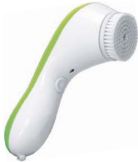
ЩЕТКА ДЛЯ ОЧИЩЕНИЯ SONICLENSE AMG195

Аппарат поможет избавиться от черных точек и улучшить внешний вид кожи. Щетка для лица подходит как для ежедневного умывания, так и для очищения пор от загрязнений.