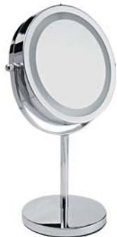
ЗЕРКАЛО С ПОДСВЕТКОЙ LM194

Удобное настольное зеркало имеет круговую подсветку и 5-кратное увеличение одной из сторон. Идеально для проведения косметических процедур.