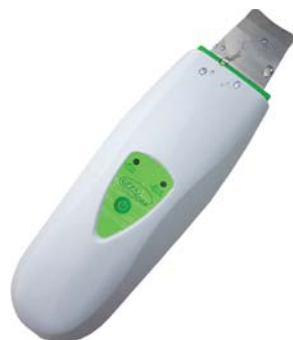
АППАРАТ ДЛЯ УЗ-ПИЛИНГА HS2307i

Попробуйте сами и увидите, что это лучшая забота о коже.