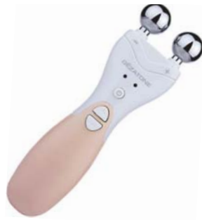
МАССАЖЕР ДЛЯ ЛИЦА МИОСТИМУЛЯЦИЯ + ГАЛЬВАНИКА BIOLIFT4 M701

Многоуровневый лифтинг и омоложение кожи, сочетающий воздействие ультразвуком и укрепление мышц при помощи электростимуляции.