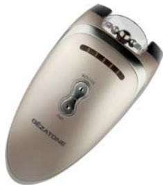
РОЛИКОВЫЙ МАССАЖЕР-МИОСТИМУЛЯТОР BIOLIFT4 M270

Это обеспечивает двойной эффект: мышцы подтягиваются, а кожа становится более упругой.