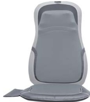
МАССАЖНАЯ НАКИДКА CYBER RELAX AMG399

Универсальная накидка-массажер для использования дома, в офисе или в автомобиле позволяет провести профессиональный массаж спины и поясницы, шеи и бедер.