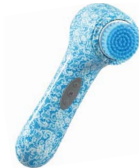
ЩЕТКА ДЛЯ ОЧИЩЕНИЯ TENDER BEAUTY AMG106SA

Три щеточки с разной щетиной идеально очищают и тонизируют кожу, удаляя комедоны и остатки макияжа. Вы увидите результат уже через 60 секунд применения!