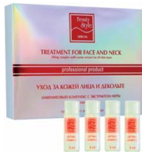
ЛИФТИНГОВАЯ СЫВОРОТКА ДЛЯ ЛИЦА С ЭКСТРАКТОМ ИКРЫ BEAUTY STYLE

Сыворотка запускает процесс естественного омоложения, обеспечивает эффект подтяжки кожи. Может применяться в процедурах аппаратного ухода или самостоятельно.