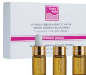
КОМПЛЕКС ОМОЛАЖИВАЮЩИЙ BEAUTY STYLE

Концентрат для проведения процедур с приборами на базе гальванических токов. Активная формула укрепляет стенки сосудов и улучшает местную микроциркуляцию.