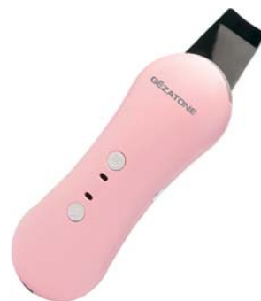
АППАРАТ ДЛЯ УЗ-ПИЛИНГА HS2307i(S)

Глубоко очищает кожу от загрязнений и черных точек, дает ей необходимое питание и увлажнение, позволяет провести высокоэффективные лифтинг-процедуры у себя дома.