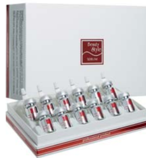
СЫВОРОТКА ДЛЯ ЛИЦА С ГИАЛУРОНОВОЙ КИСЛОТОЙ BEAUTY STYLE

Сыворотка запускает процесс естественного омоложения, обеспечивает эффект подтяжки кожи. Может применяться в процедурах аппаратного ухода или самостоятельно.