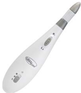
НАБОР ДЛЯ МАНИКЮРА И ПЕДИКЮРА PROFESSIONAL NAIL CARE 136D

Аппарат для проведения маникюра и педикюра оснащен семью сменными насадками с сапфировым напылением. Имеет сенсорное управление и подсветку.