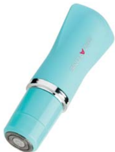
УНИВЕРСАЛЬНАЯ БРИТВА ДЛЯ ЖЕНЩИН DP512

Настоящий помощник для прекрасных дам. Три насадки: для стрижки, бритья и очищения кожи – то, что нужно дома и в путешествии!