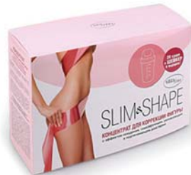
КОНЦЕНТРАТ-ПРОПИТКА ДЛЯ ПОХУДЕНИЯ SLIM&SHAPE

Элегантный комбидрес поможет избавиться от избыточных жировых отложений и выровнять рельеф кожи, уменьшит объемы бедер и придаст фигуре изящество.