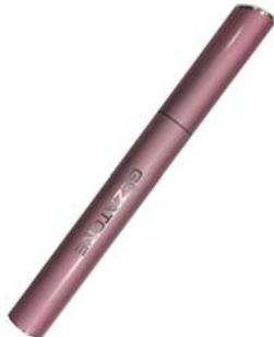
ТРИММЕР ДЛЯ БРОВЕЙ И ЗОНЫ БИКИНИ DP508

Компактная и безопасная бритва избавит Вас от лишних волос на ногах, в области подмышек и бикини. И все это без особого труда!