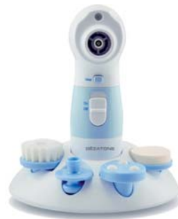
ВАКУУМНЫЙ ОЧИСТИТЕЛЬ КОЖИ SUPER WET CLEANER PRO

Классическая паровая сауна для лица оснащена удобной чашей и насадкой для ингаляции, имеет регулировку мощности подачи пара.