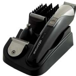
МАШИНКА ДЛЯ СТРИЖКИ И ПОДРАВНИВАНИЯ БОРОДЫ BP 207

Миниатюрная машинка для безупречного удаления волос на лице и теле, коррекции линии бикини и бровей. Везде с Вами, чтобы обеспечить необходимый уход.