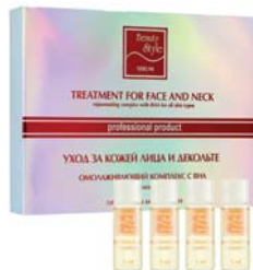
СЫВОРОТКА ДЛЯ ЛИЦА РЕГУЛИРУЮЩАЯ BEAUTY STYLE

Средство нормализует салоотделение, уменьшает диаметр пор, снимает воспаление. Применяется как самостоятельное средство или в сочетании с УЗ-массажем и микротоками.