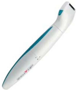
МАШИНКА ДЛЯ СТРИЖКИ И БИКИНИ-ДИЗАЙНА 3 В 1 DP515

Настоящий помощник для прекрасных дам. Три насадки: для стрижки, бритья и очищения кожи – то, что нужно дома и в путешествии!