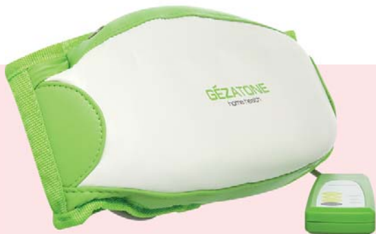
МАССАЖНЫЙ ПОЯС ДЛЯ ПОХУДЕНИЯ HOME HEALTH M141

Использовать массажные пояса можно для уменьшения жировых отложений, повышения тонуса мышц, вывода застоявшейся жидкости. Они применяются и для восстановления после тренировок. Одним словом – настоящий кладезь полезных свойств для тех, кто всерьез решил добиться идеальной фигуры!