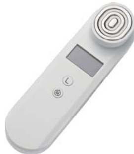
АППАРАТ RF-ЛИФТИНГ + МИКРОТОКИ M1605

Безоперационная подтяжка лица дома! Курс процедур поможет Вам стать на несколько лет моложе. Функция миостимуляции восстановит тонус мышц лица и тела.