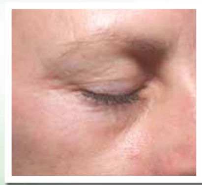
Через 4 недели

“Это выглядит так, как будто кто-то разгладил мои морщины”